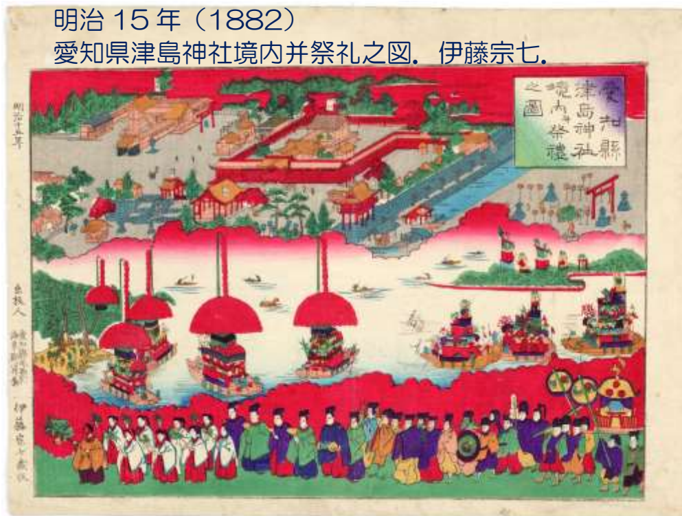
愛知県津島神社境内并祭礼之図。伊藤宗七。