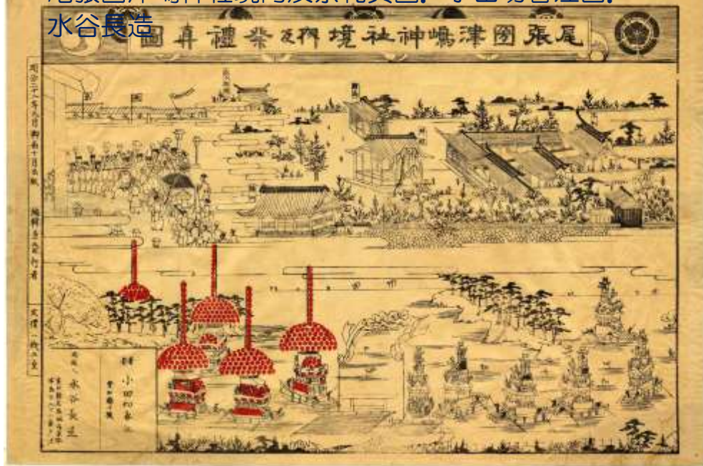
明治 22 年 (1889) 9 月 尾張国津嶋神社境内及祭礼真図。小田切春江画。 水谷長造