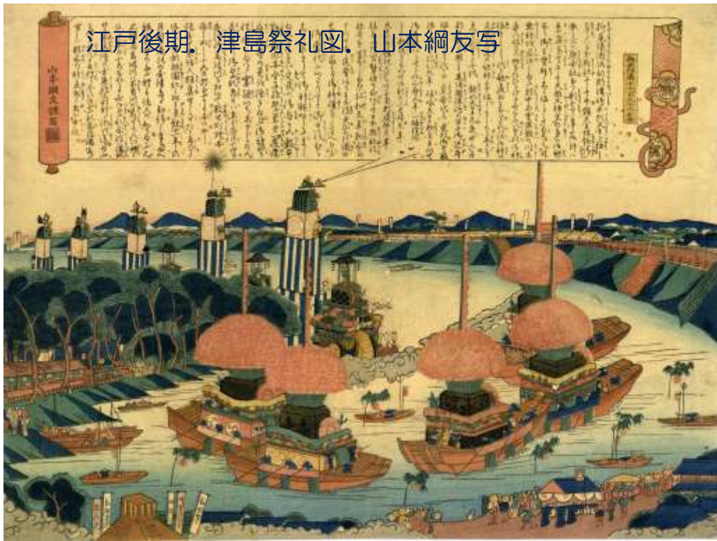
江戸後期。津島祭礼図。山本綱友写