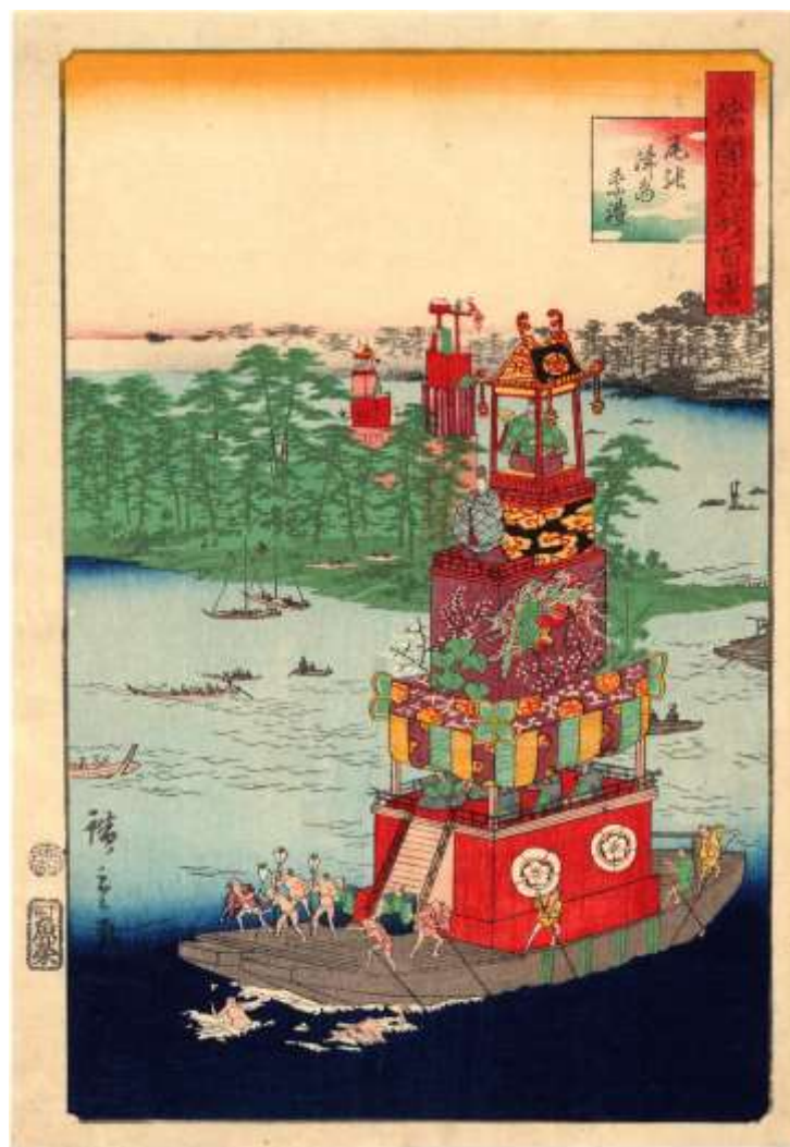
江戸後期。安政6年（1859） 二代歌川広重。諸国名所百景。尾張 津島祭礼②