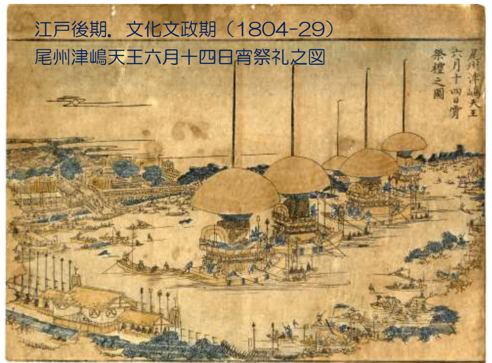
尾州津嶋天王六月十四日宵祭礼之図