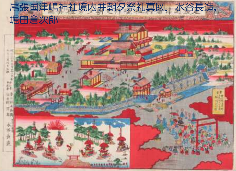
明治 24 年 (1891) 6 月 21 日 尾張国津嶋神社境内并朝夕祭礼真図。水谷長造， 堀田倉次郎