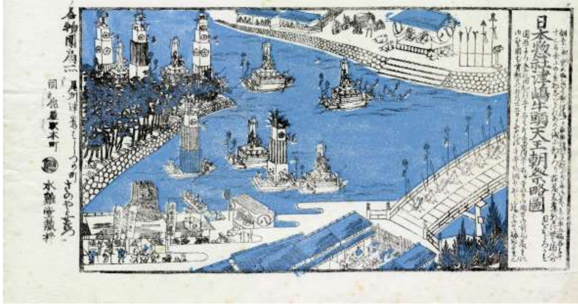
江戸中期。津島牛頭天王御祭礼信楽略図。津島神社