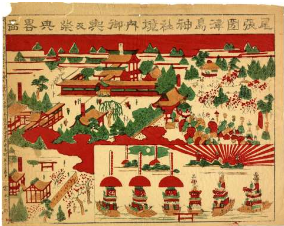
明治33年(1900)8月 尾張国津島神社境内御輿及祭典略図。富永七三郎