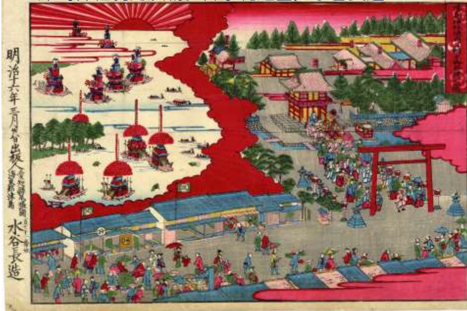
明治 16 年 (1883) 3 月 28 日 津島神社境内及朝夕御祭礼之図。水谷長造