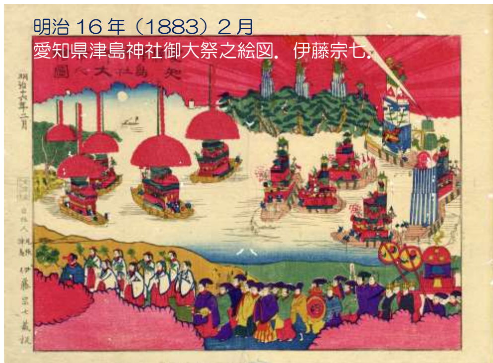
愛知県津島神社御大祭之絵図。伊藤宗七。