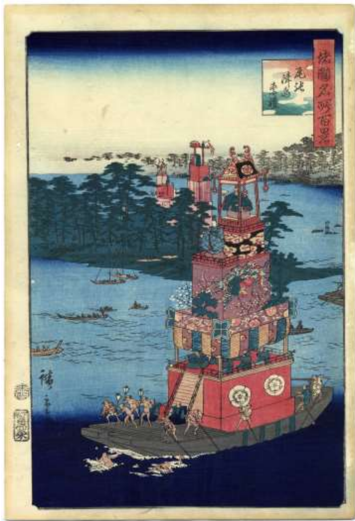
江戸後期。安政6年（1859） 二代歌川広重。諸国名所百景。尾張 津島祭礼①