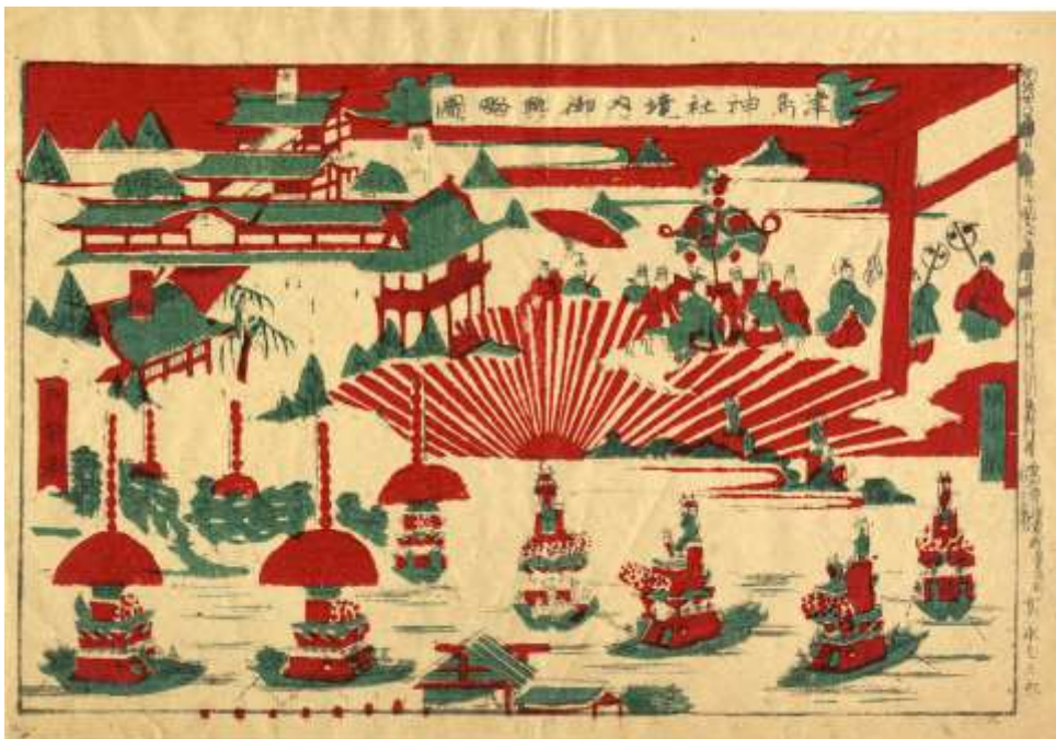
明治38年(1905) 津島神社境内御輿略図。富永七三郎