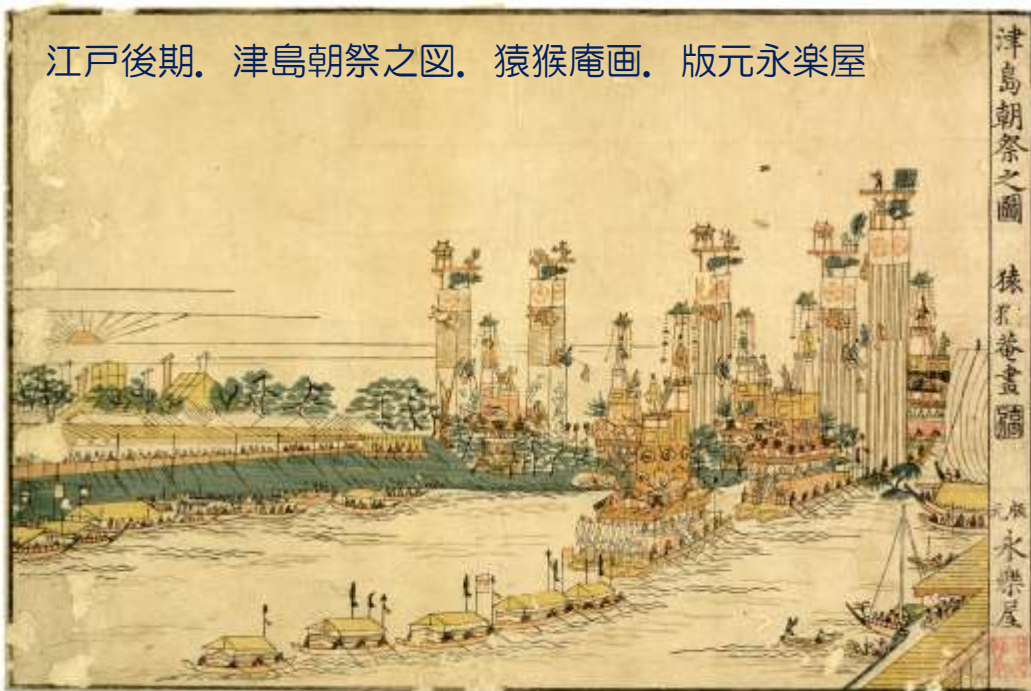
江戸後期。津島朝祭之図。猿猴庵画。版元永楽屋