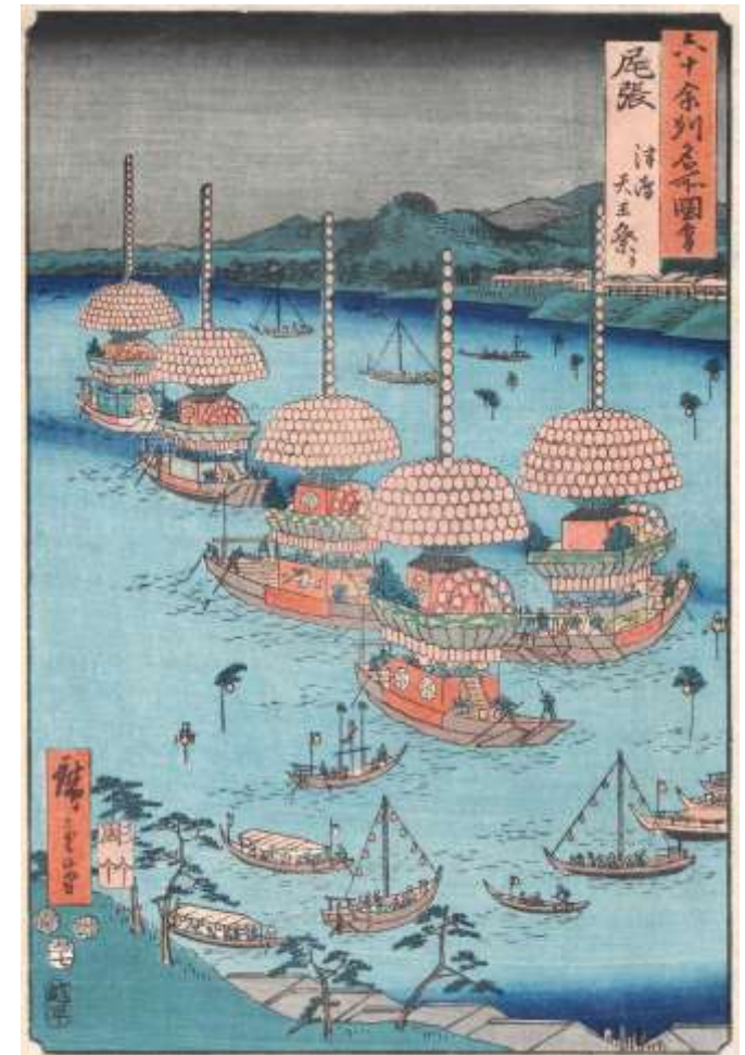
「尾張津島天王祭」（江戸後期） 津島市立図書館所蔵

なお、天王祭は 500年以上の歴史 を持っており、現在でも多くの人々が 荘厳な宵祭 と 華麗な朝祭 に魅了されています。