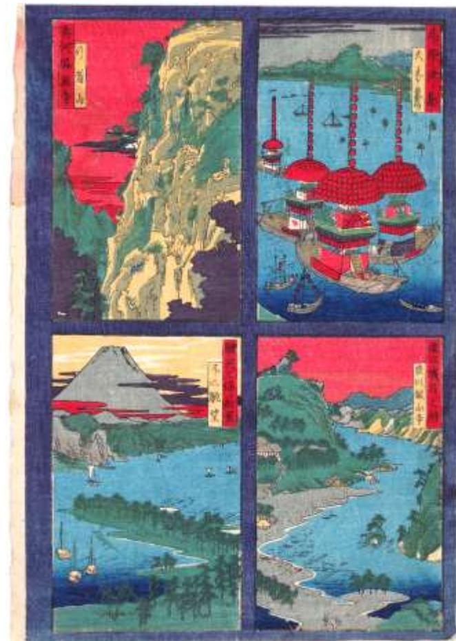
江戸後期 六十余洲名所図会。尾張津島天王祭 ほか3点