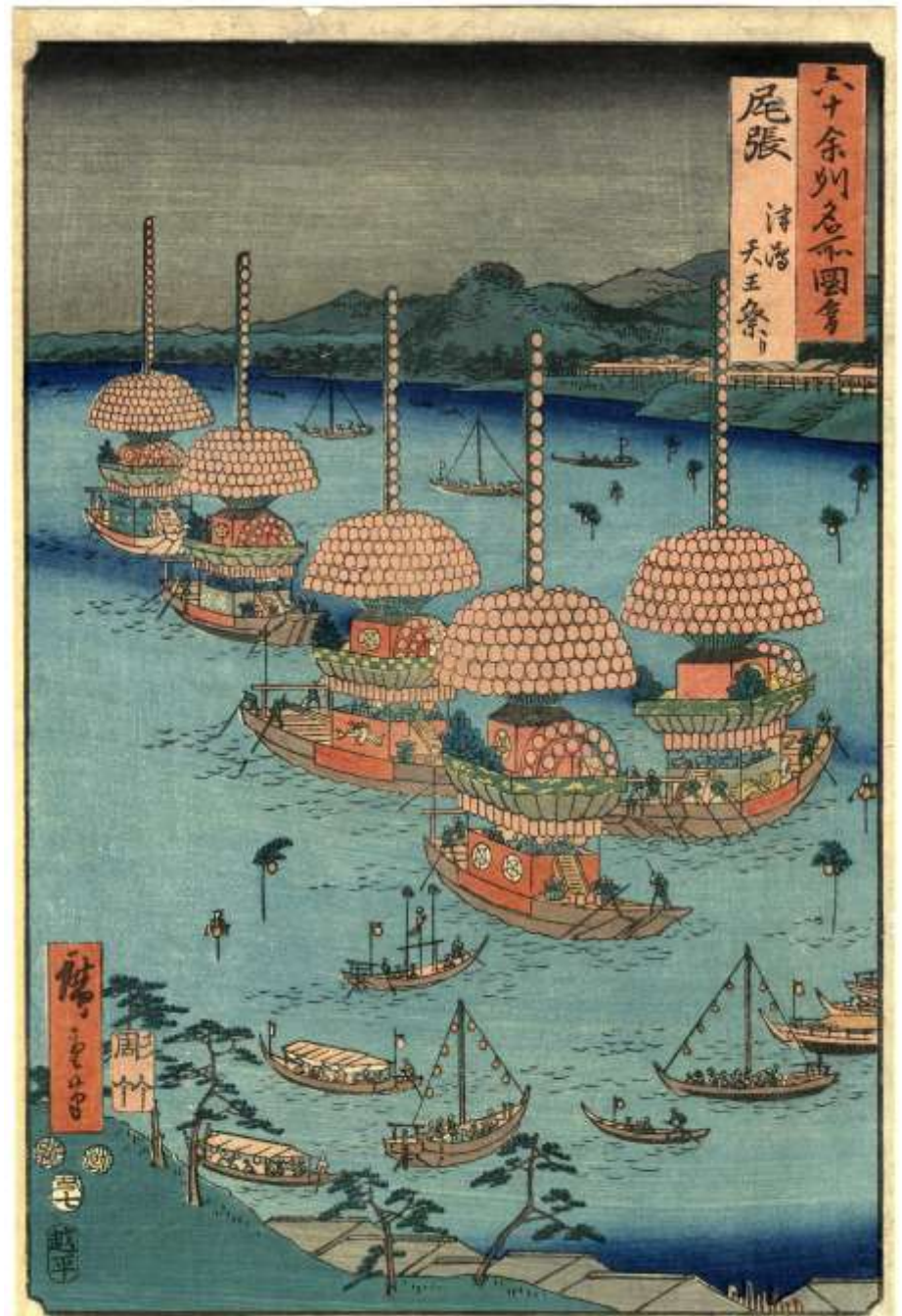
江戸後期。安政2年(1855)頃 歌川広重。六十余州名所図会。尾張津島天王祭り