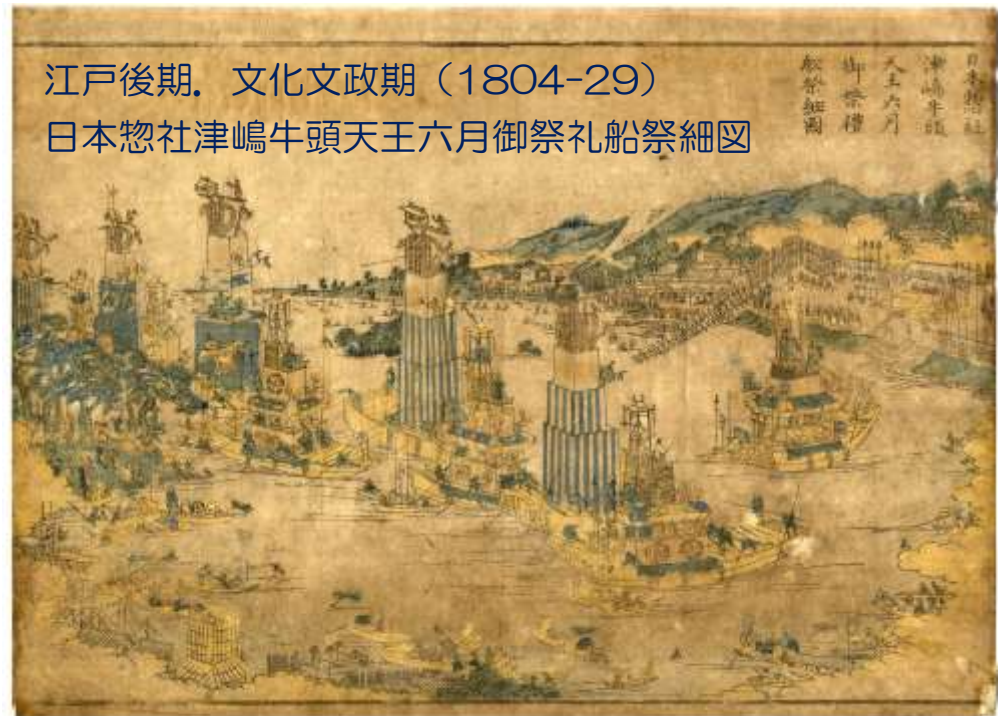
日本惣社津嶋牛頭天王六月御祭礼船祭細図